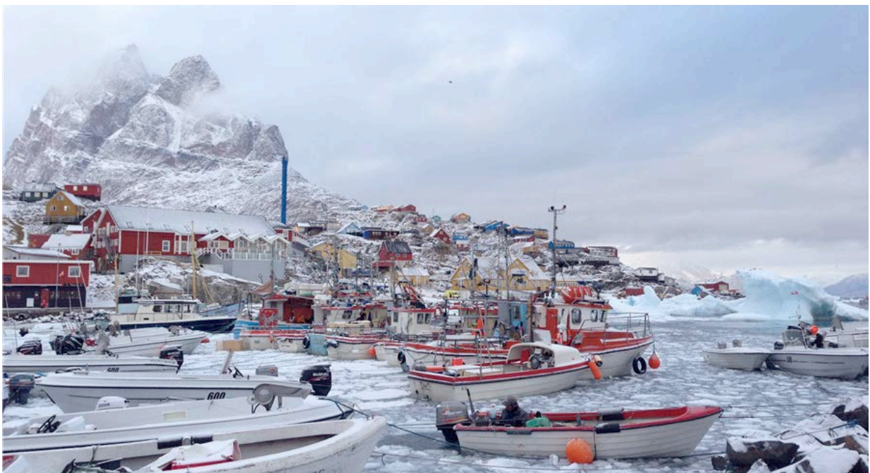
Baie D'Uumannaq

Rapidement se posent les problématiques de « rapport de force » face à ceux qui n'auraient intérêt à ce que rien ne change et qui n'auraient qu'une vision à court terme.