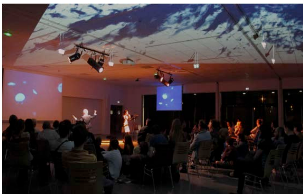
Les poissons ont-ils toujours raison ? – Océanopolis (2014)

Cinq formes hybrides nommées CÔTE à CÔTE , résultats de plusieurs mois de co-construction entre cinq artistes et cinq scientifiques organisés en binômes. Cette dernière expérience autour de l'adaptation aux changements climatiques a donné lieu à cinq représentations en zone côtière finistérienne (dans le cadre du projet ARTisticc et soutenu par la fondation Daniel & Nina Carrasso en 2016).